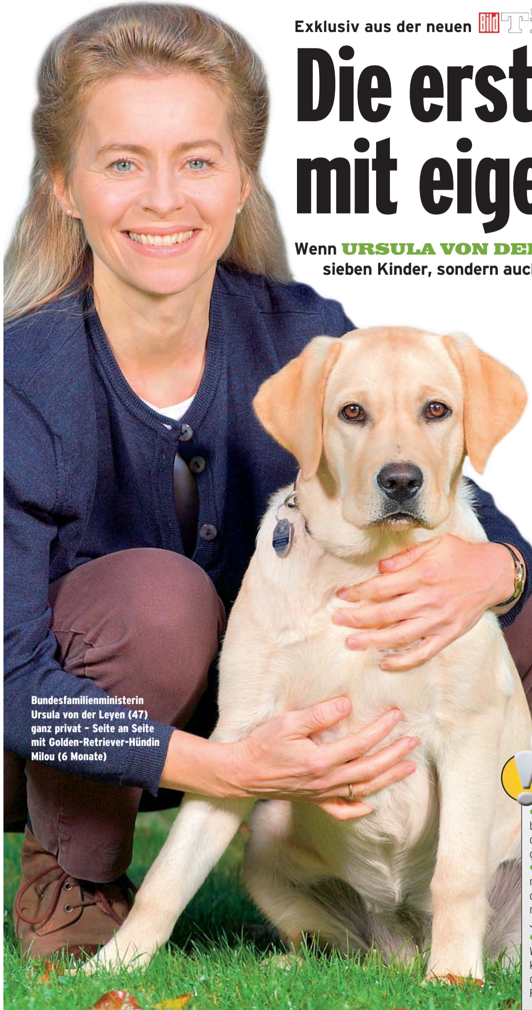
Bundesfamilienministerin Ursula von der Leyen (47) ganz privat - Seite an Seite mit Golden-Retriever-Hündin Milou (6 Monate)