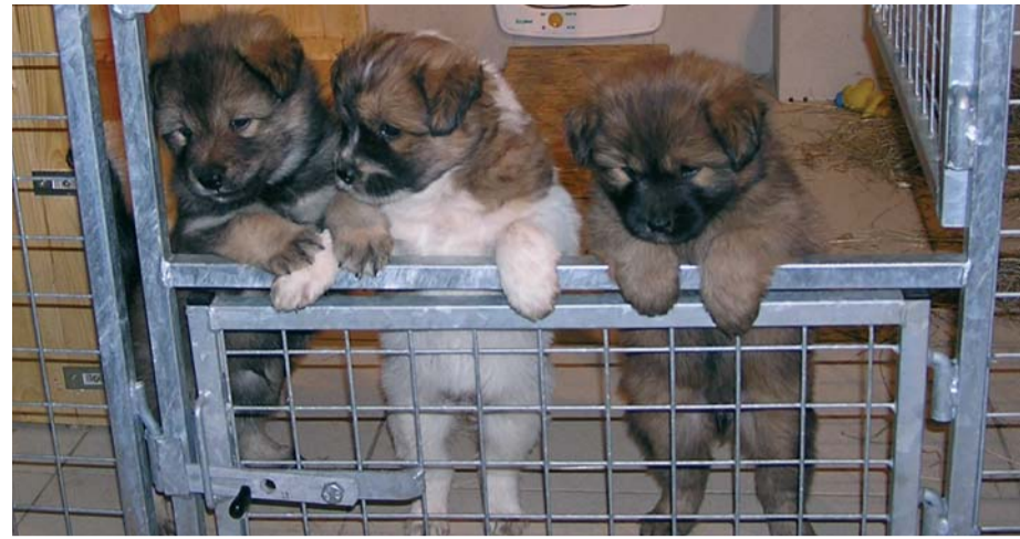
Bestechen einfach nur durch ihre Niedlichkeit: Hundewelpen.

Wer auf Nummer sicher gehen will, wendet sich an die Hunde-