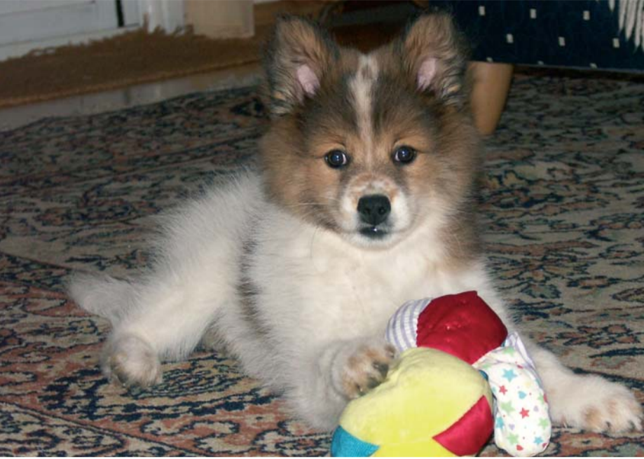
Ein Hund – auch als Geschenk – bedeutet Verantwortung.