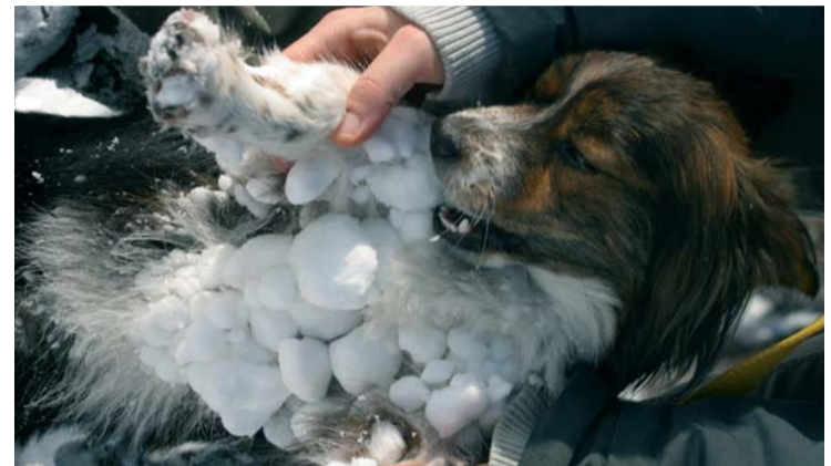
Hier muss unbedingt Hand angelegt werden.

schließt auch gefährdete Wundrisse an den Ballen und beugt so einem Eindringen von Salz vor. Ein anderes Mittel, das oft empfohlen wird, ist Melkfett. Es stößt Feuchtigkeit ab, ist aber flüssiger und günstiger als Hirschtalg. Im Supermarkt kosten 100 Milliliter in der Regel deutlich weniger als ein Euro. Nach einem Spaziergang im Winter ist es gut, die Pfoten mit lauwarmem Wasser abzuwaschen, um Salzurückstände zu entfernen. Danach kann wiederum Pflegemittel aufgetragen werden. Beim Abduschen der Pfoten werden auch lästige Eisklumpen entfernt, die sich zwischen den Zehen festsetzen können. Lange Haare an den Pfoten sollten auf keinen Fall abgeschnitten werden – das führt leicht zu Reizungen. Lässt sich längeres Laufen auf gestreuten Wegen nicht vermeiden, sind die Tiere empfindlich oder haben sich bereits Wunden an den Pfoten zugezogen, ziehen Hundebesitzer ihren Lieblingen auch so genannte Booties, Hundeschuhe, an. Sie werden in der Arktis für Schlittenhunde benutzt. Deshalb findet man sie – außer in den meisten Hundesportläden – am besten im Internet unter Stichworten wie „Sleddog“ oder „Schlittenhunde-Zubehör“. Ein Bootie kostet zirka drei Euro. Für den Notfall hilft aber auch erst einmal eine am Lauf abgeklebte Plastiktüte.